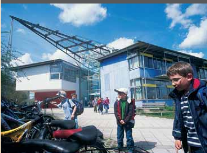
Schule am Lichtacker, Tiefenbach