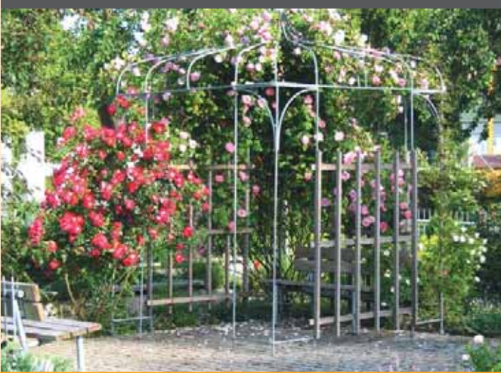
Rosengarten Pestalozzi Straße

Umwelt: In Illertissen sich auch in Zukunft wohlfühlen.