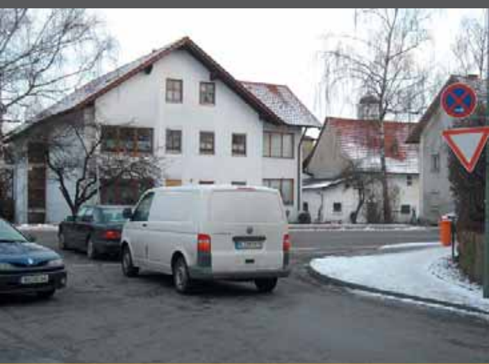
Einmündung Kempter Straße