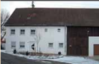
Kulturstadel in Au

Au, Betlinshausen, Jedesheim und Tiefenbach: Gemeinsam mit Illertissen stark.