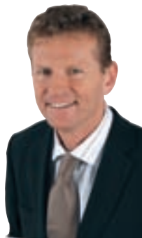
Autor: Günther Felbinger, MdL

In der Folge nahm - absehbar - die Bewegungsarmut zu. Immer mehr Kinder und Jugendliche leiden heute an dadurch bedingten Krankheiten. Grund genug für die FW, das Thema im Landtag aufzugreifen. So behandelte das Plenum in einer seiner Aktuellen Stunden das von den FW beantragte Thema: „Bayerns Schüler brauchen mehr Bewegung!“