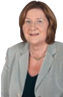
Autorin: Eva Gottstein, MdB

Die Berufliche Mittelschule soll grundsätzlich mit der zehnten Klasse abschließen und zu einem Mittleren Bildungsabschluss führen. Mit dem erfolgreichen Besuch der 10. Klasse wäre dann in Analogie zur Realschule