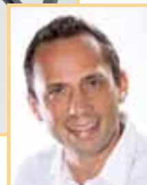
Thorsten Glauber (Pinzberg) ist energie- und jugendpolitischer Sprecher der Landtagsfraktion